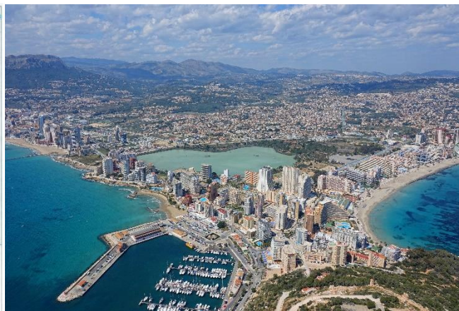
Figura 2: Calpe (Alicante) / Fonte: es.wikipedia.org/wiki/Calpe

Atendendo ás figuras 1 e 2, conteste: a) Cite as cinco Comunidades Autónomas peninsulares que teñen áreas turísticas de alta densidade e nomee cinco tipos de turismo que teñen importancia en España (figura 1). (1 punto) ; b) Identifique os tipos de documentos e describa a información presentada nas figuras 1 e 2 (1 punto) ; c) Comente a figura 2, analizando a súa posible localización, os elementos naturais e/ou humanos e características deste espazo relacionándoos co tipo de actividade dominante. (1,5 puntos) ; d) Explique brevemente os principais problemas que presenta a actividade económica dominante na paisaxe da figura 2 (1,5 puntos) .