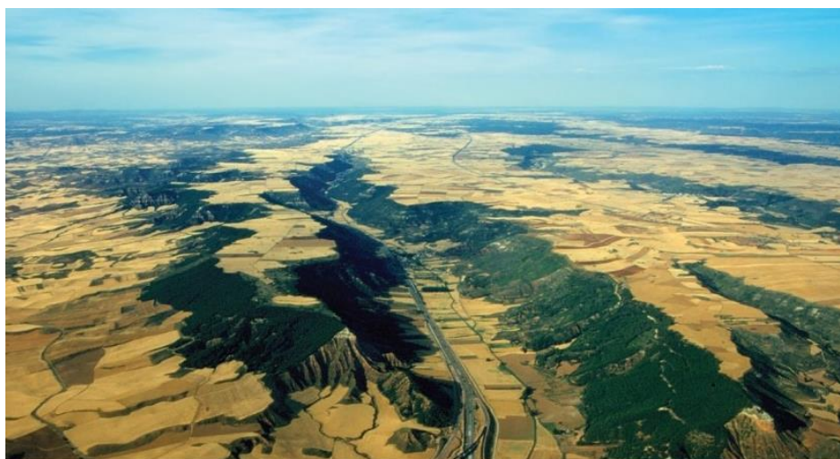
Figura 4. Vista aérea da Alcarria.